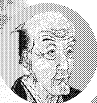
上杉鷹山(米沢市 上杉博物館所蔵)